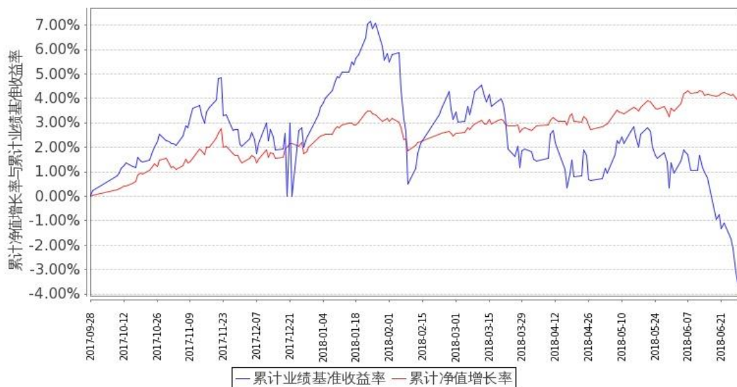
图 1：嘉实新添辉定期混合 A 基金累计份额净值增长率与同期业绩比较基准收益率的历史走势对比图