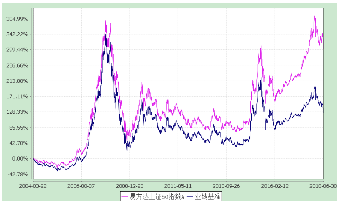
易方达上证 50 指数 C