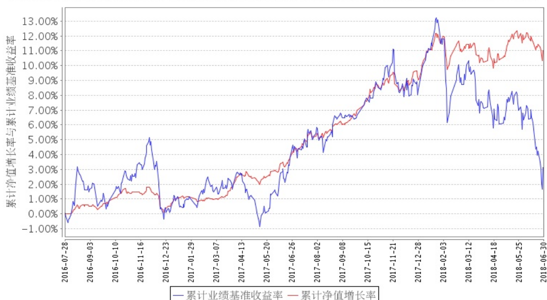
安信新优选混合A累计净值增长率与同期业绩比较基准收益率的历史走势对比图