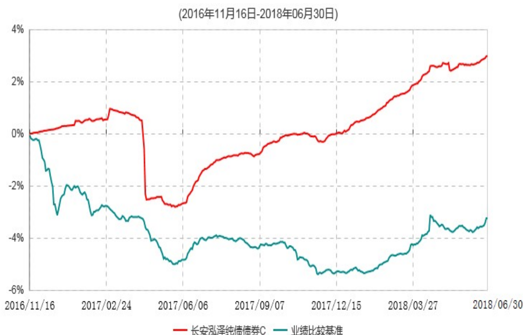
长安泓泽纯债债券C累计净值增长率与业绩比较基准收益率历史走势对比图

本基金基金合同生效日为 2016 年 11 月 16 日，按基金合同规定，本基金自基金合同生效起 6 个月为建仓期，截止到建仓期结束时，本基金的各项投资组合比例已符合基金合同的相关规定。基金合同生效日至报告期期末，本基金运作时间已满一年，图示日期为 2016 年 11 月 16 日至 2018 年 6 月 30 日。