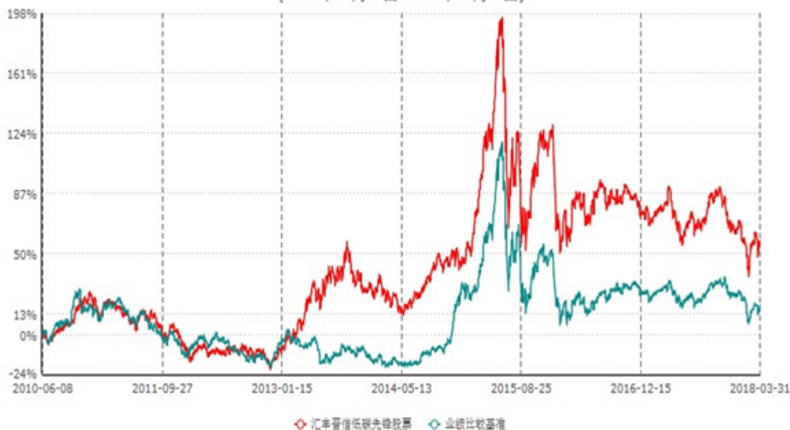
汇丰晋信低碳先锋股票型证券投资基金累计净值增长率与业绩比较基准收益率历史走势对比图 (2010年06月08日-2018年03月31日)