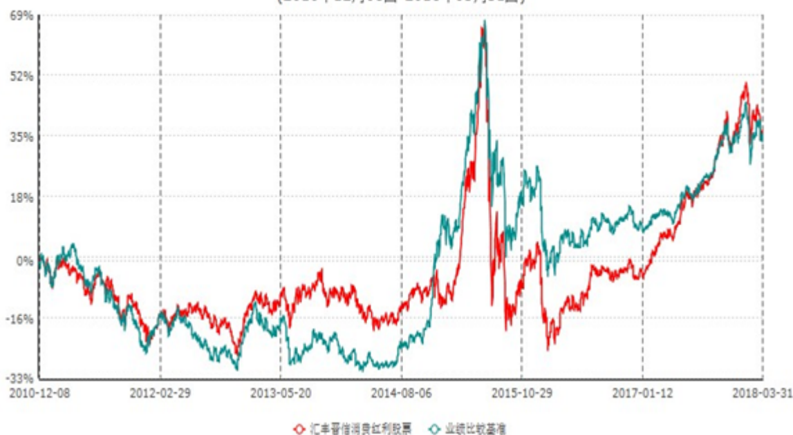
汇丰晋信消费红利股票型证券投资基金累计净值增长率与业绩比较基准收益率历史走势对比图 (2010年12月08日-2018年03月31日)

注：1. 按照基金合同的约定，本基金的投资组合比例为：股票投资比例范围为基金资产的 85%–95%，权证投资比例范围为基金资产净值的 0%–3%。固定收益类证券、现金和其他资产投资比例范围为基金资产的 5%–15%，其中现金（不包括结算备付金、存出保证金、应收申购款等）或到期日在一年以内的政府债券的投资比例不低于基金资产净值的 5%。按照基金合同的约定，本基金自基金合同生效日起不超过 6 个月内完成建仓，截止 2011 年 6 月 8 日，本基金的各项投资比例已达到基金合同约定的比例。