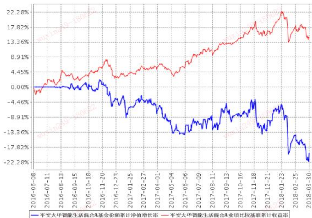
平安大华智能生活混合A基金份额累计净值增长率与同期业绩比较基准收益率的历史走势对比图