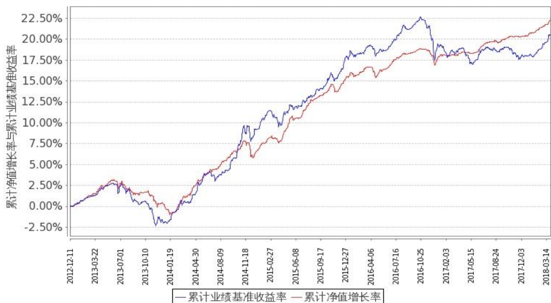
图1：嘉实纯债债券A基金份额累计净值增长率与同期业绩比较基准收益率的历史走势对比