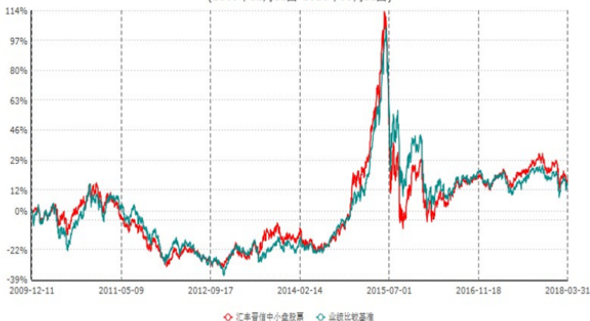
汇丰晋信中小盘股票型证券投资基金累计净值增长率与业绩比较基准收益率历史走势对比图 (2009年12月11日-2018年03月31日)