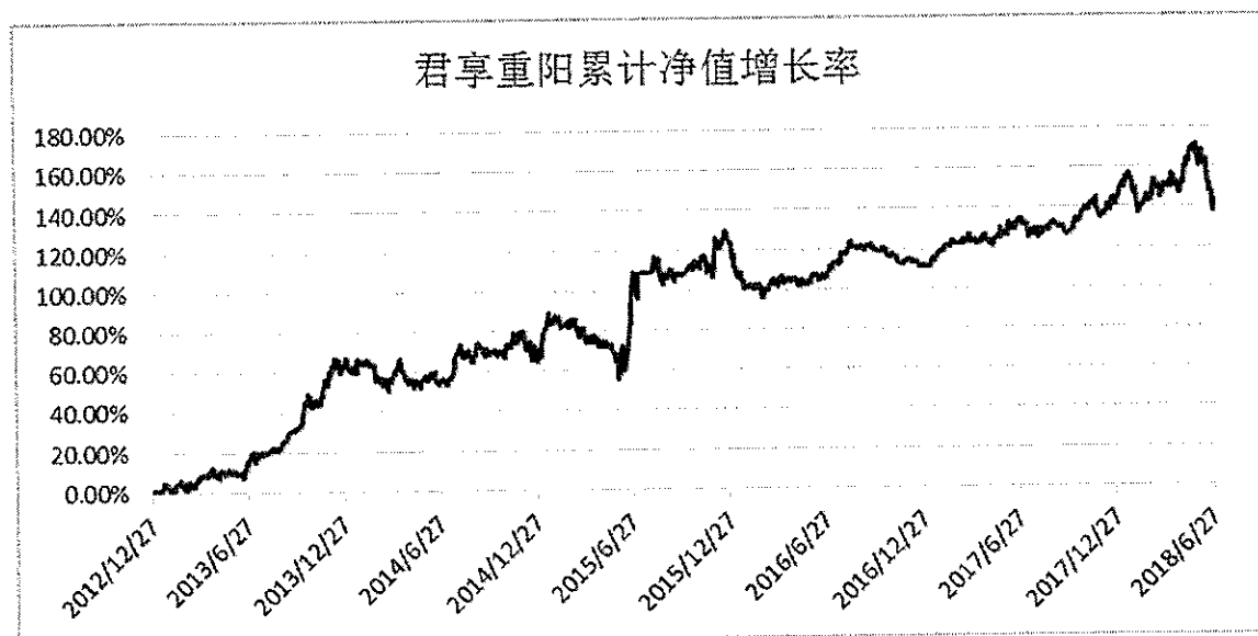
集合计划累计份额净值增长率历史走势图