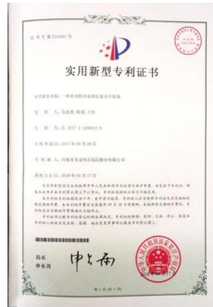
2018 年 4 月 17 日获得“一种多切削金刚石复合片钻头”实用新型专利证书