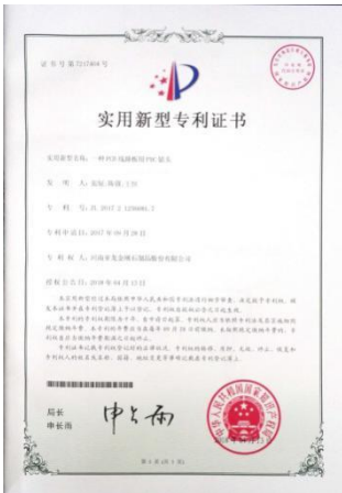
2018 年 4 月 13 日获得“一种 PCB 线路板用 PDC 钻头”实用新型专利证书