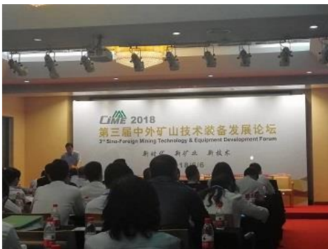
2018 年 6 月 6 日在北京参加“2018 年第三届中外矿山技术装备发展论坛”。