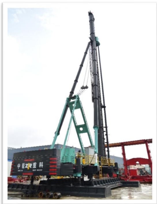
2018年5月3日公司第一台 ZRM220/85-3 多轴动力头钻机成功下线