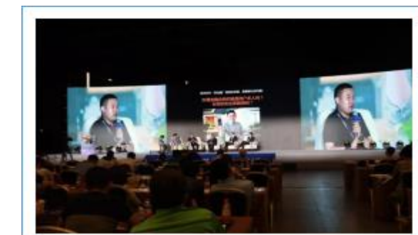
全球人工智能大会中德宏泰发布新产品 AI mini box & smart mini box