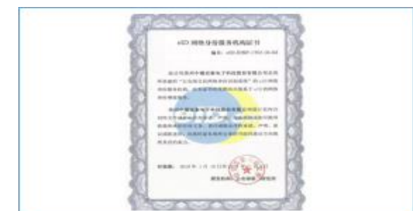
发布 eID 数字身份体系