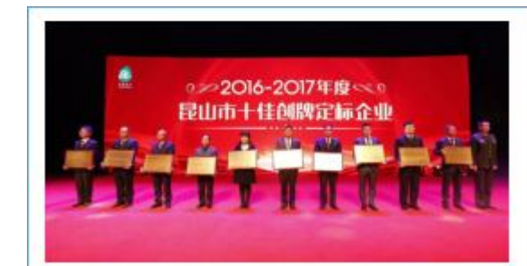
十佳创牌定标企业