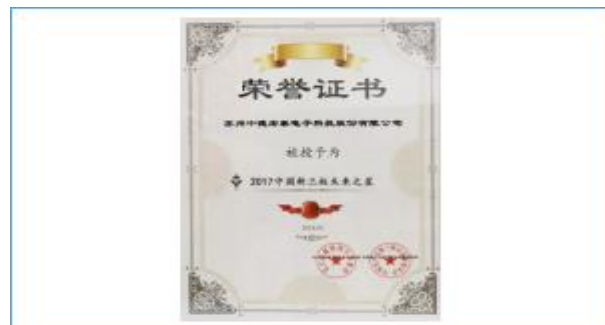
荣获“2017中国新三板未来之星奖”