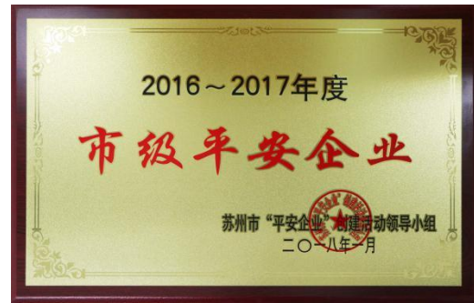
中德宏泰荣获“市级平安企业”称号