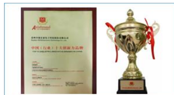
中国(行业)十大创新力品牌 中国品牌建设优秀人物