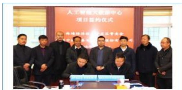
曲靖人工智能大数据中心项目签约仪式