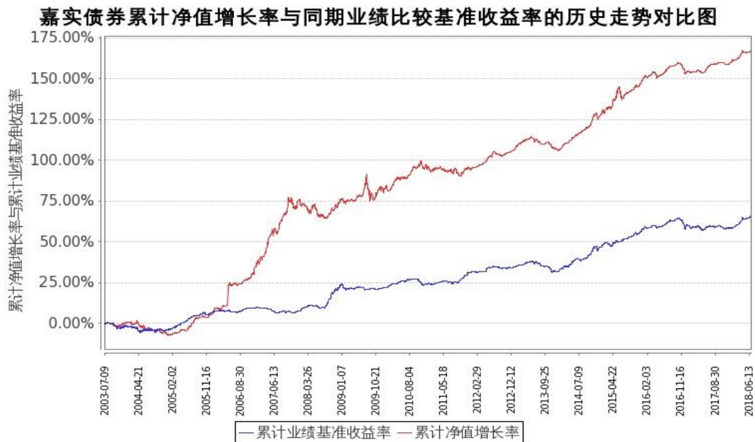
图：嘉实债券份额累计净值增长率与同期业绩比较基准收益率的历史走势对比图

2、自基金合同生效以来基金累计净值增长率变动及其与同期业绩比较基准收益率变动的比较