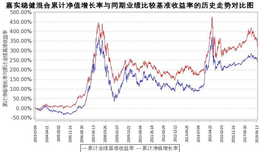
图：嘉实稳健混合份额累计净值增长率与同期业绩比较基准收益率的历史走势对比图

2、自基金合同生效以来基金累计净值增长率变动及其与同期业绩比较基准收益率变动的比较