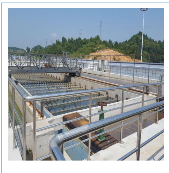
公司万载 BDP 工艺设备供货项目完成