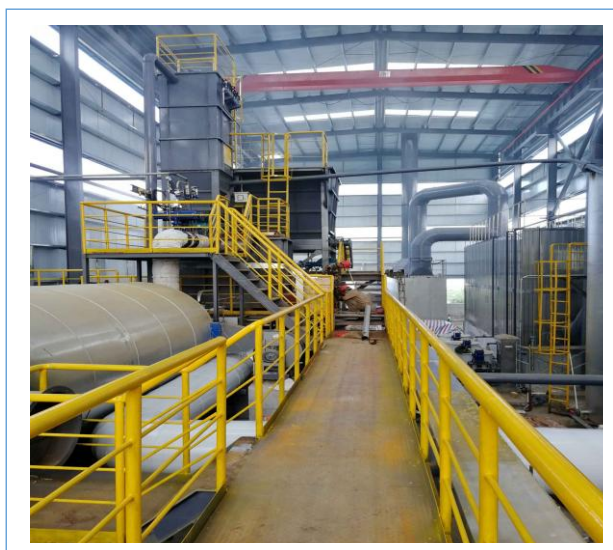
公司钟祥市污泥碳化项目开工建设