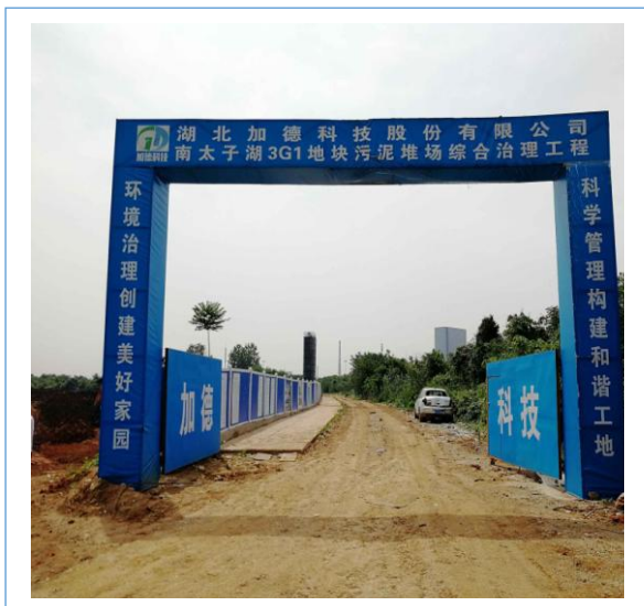
公司南太子湖 3G1 地块污泥堆场综合治理工程开工建设