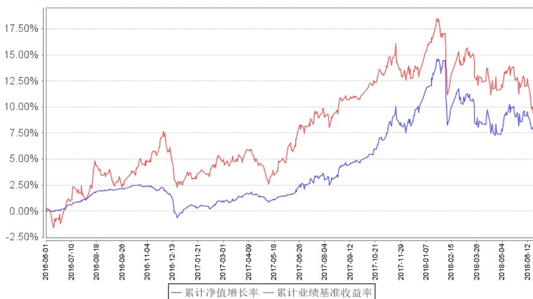
鹏华兴泽A 累计净值增长率与同期业绩比较基准收益率的历史走势对比图