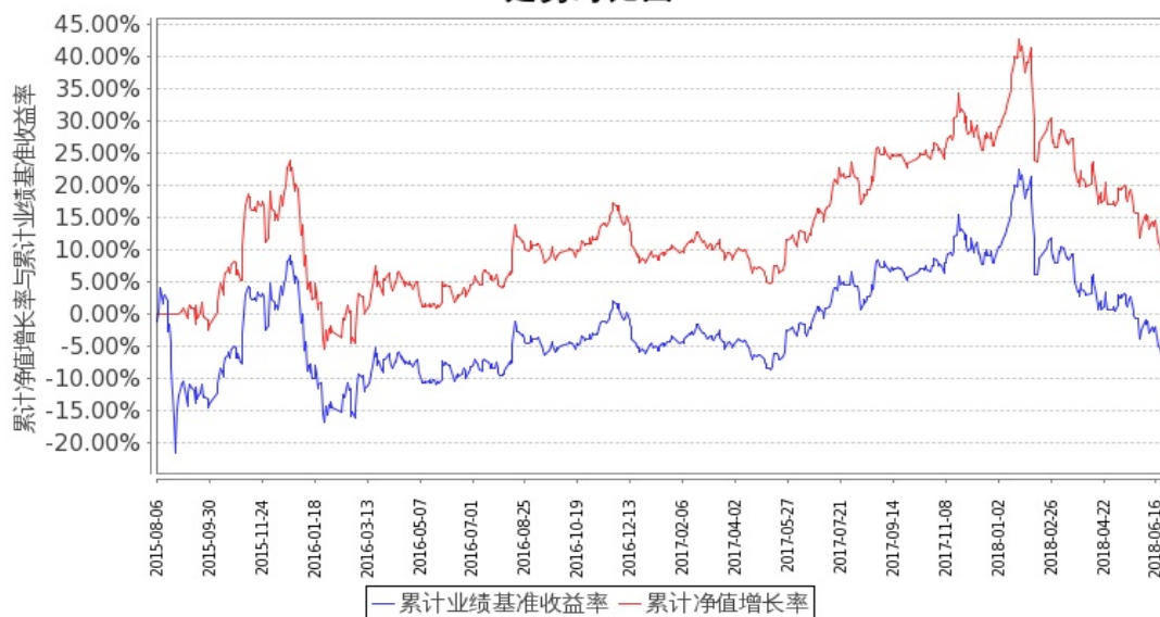
图：嘉实中证金融地产 ETF 联接 A 基金份额累计净值增长率与同期业绩比较基准收益率的历史走势对比图 (2015 年 8 月 6 日至 2018 年 6 月 30 日)