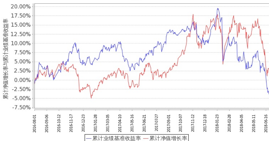
图 2：嘉实成长收益混合 H 基金份额累计净值增长率与同期业绩比较基准收益率的历史走势对比图