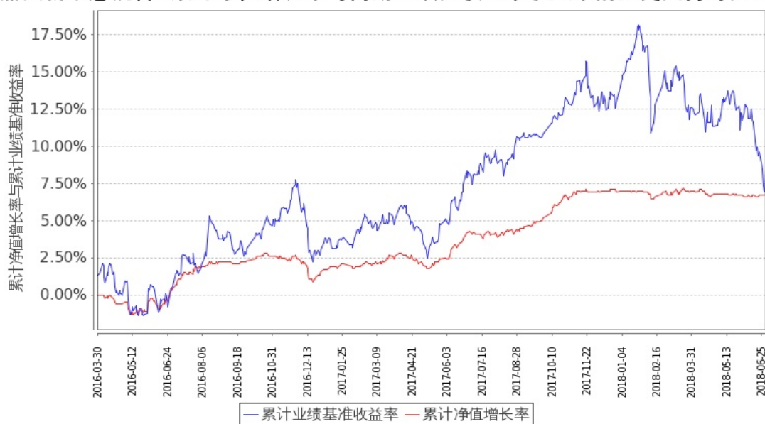
图 2：嘉实新常态混合 C 基金份额累计净值增长率与同期业绩比较基准收益率的历史走势对比图