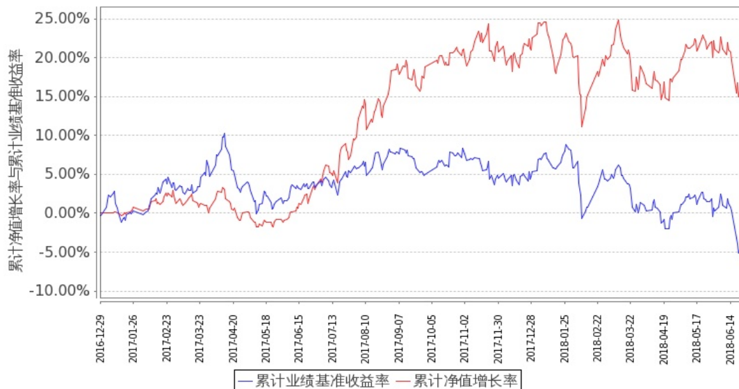
图 2: 嘉实物流产业股票 C 基金累计份额净值增长率与同期业绩比较基准收益率的