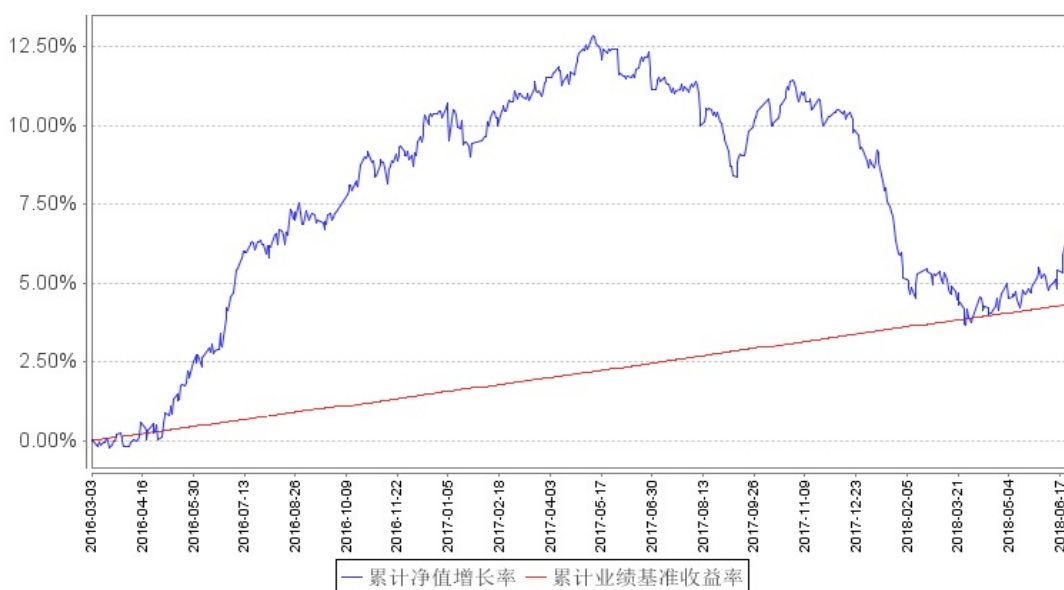
南方亚洲美元债A累计净值增长率与同期业绩比较基准收益率的历史走势对比图