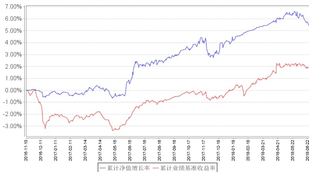
南方卓元债券A累计净值增长率与同期业绩比较基准收益率的历史走势对比图