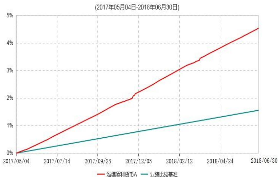
泓德添利货币A累计净值收益率与业绩比较基准收益率历史走势对比图