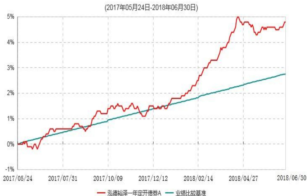
泓德裕泽一年定开债券A累计净值增长率与业绩比较基准收益率历史走势对比图