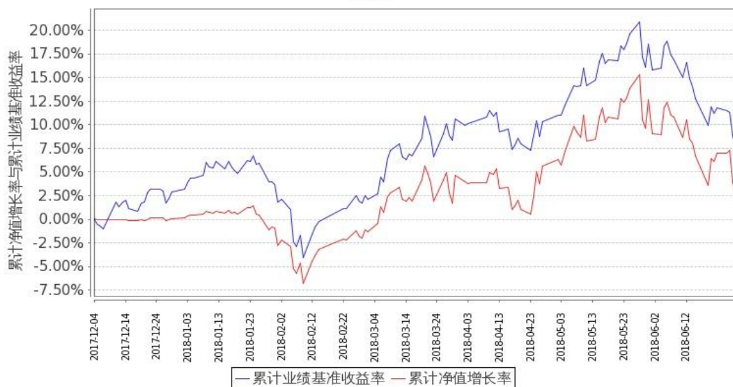
图 2：嘉实医药健康股票 C 基金累计份额净值增长率与同期业绩比较基准收益率的历史走势对比图