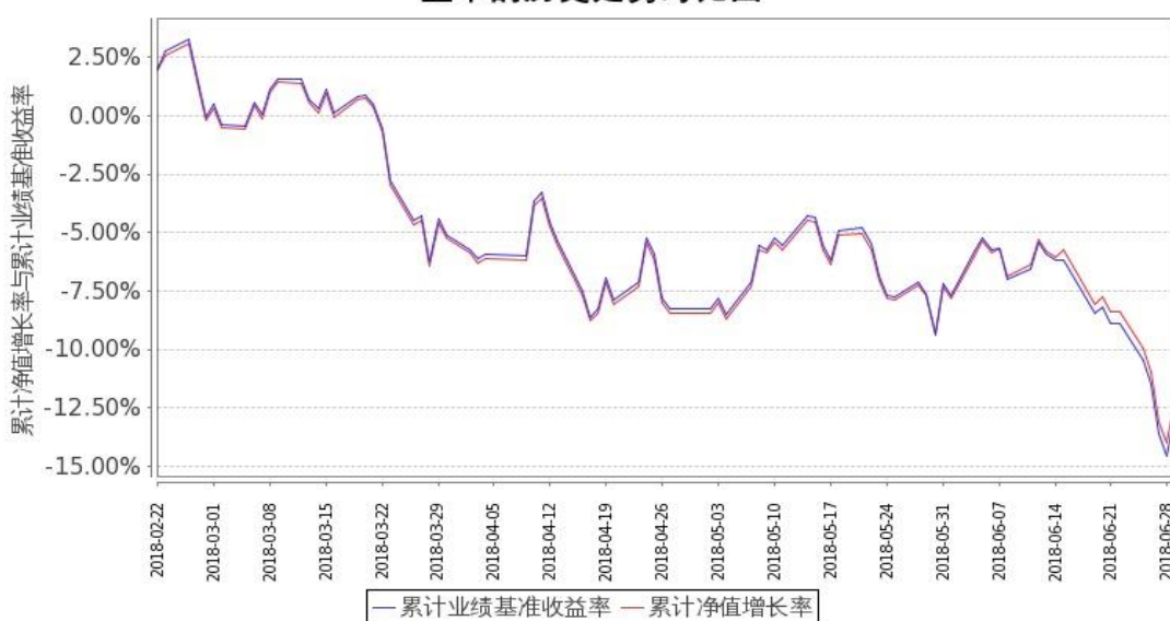
嘉实富时中国A50ETF联接基金C类基金累计净值增长率与同期业绩比较基准收益率的历史走势对比图