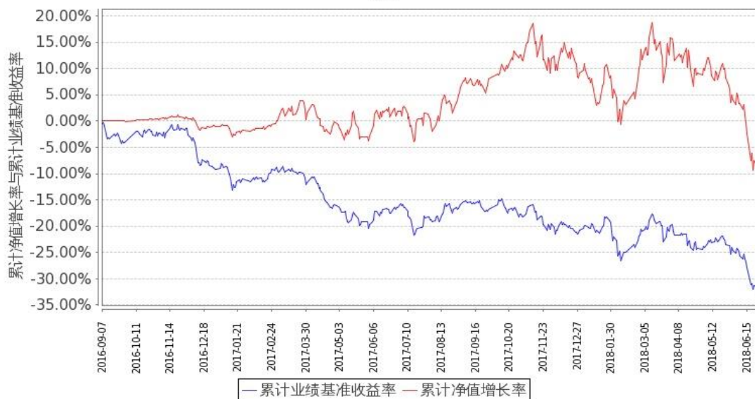
图 2：嘉实文体娱乐股票 C 基金累计份额净值增长率与同期业绩比较基准收益率的历史走势对比图