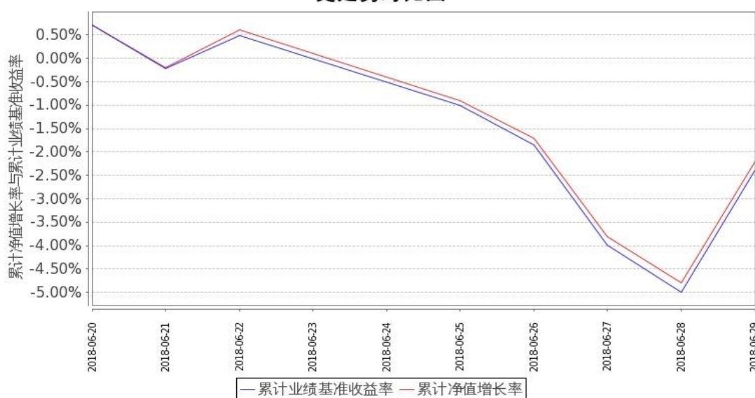
嘉实深证基本面120ETF联接C累计净值增长率与同期业绩比较基准收益率的历史走势对比图