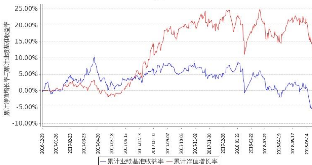
图 2：嘉实物流产业股票 C 基金累计份额净值增长率与同期业绩比较基准收益率的历史走势对比图