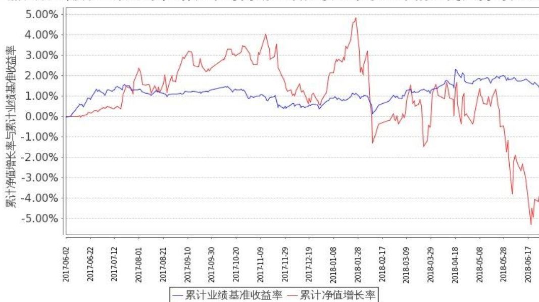
图 1：嘉实稳宏债券 A 基金份额累计净值增长率与同期业绩比较基准收益率的历史走势对比图 (2017 年 6 月 2 日至 2018 年 6 月 30 日)