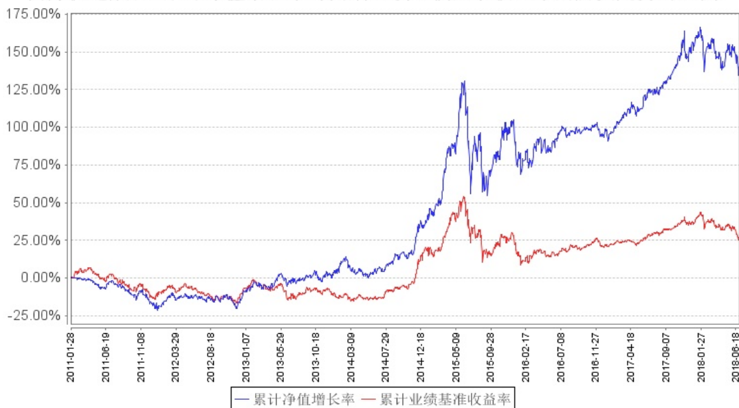
南方优选成长A累计净值增长率与同期业绩比较基准收益率的历史走势对比图