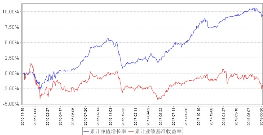
南方荣光灵活配置混合A累计净值增长率与同期业绩比较基准收益率的历史走势对比图