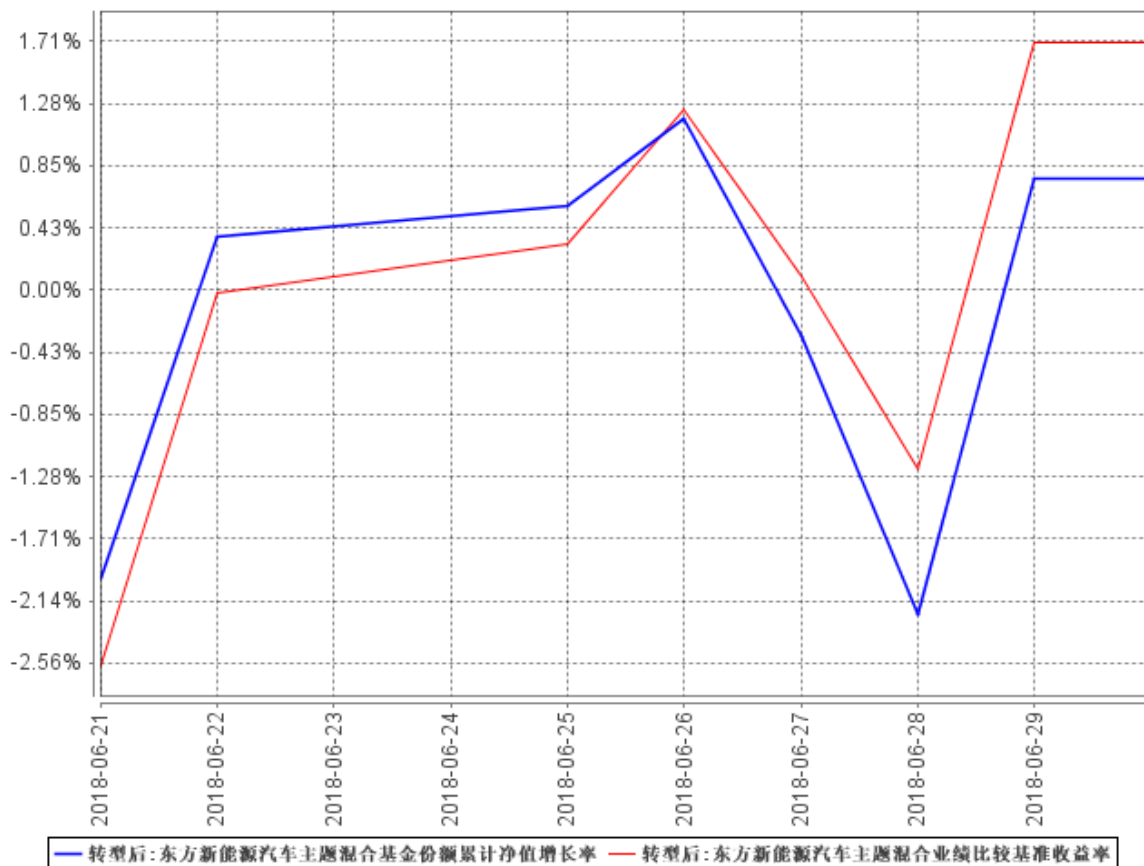
东方新能源汽车主题混合基金份额累计净值增长率与同期业绩比较基准收益率的历史走势对比图

注:本基金于 2018 年 6 月 21 日转型,截至报告期末,本基金合同生效不满六个月,仍处于建仓期。