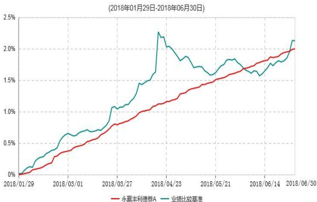
永赢丰利债券A累计净值增长率与业绩比较基准收益率历史走势对比图

注：1、本基金合同生效日为 2018 年 1 月 29 日，截至本报告期末本基金合同生效未满 1 年；