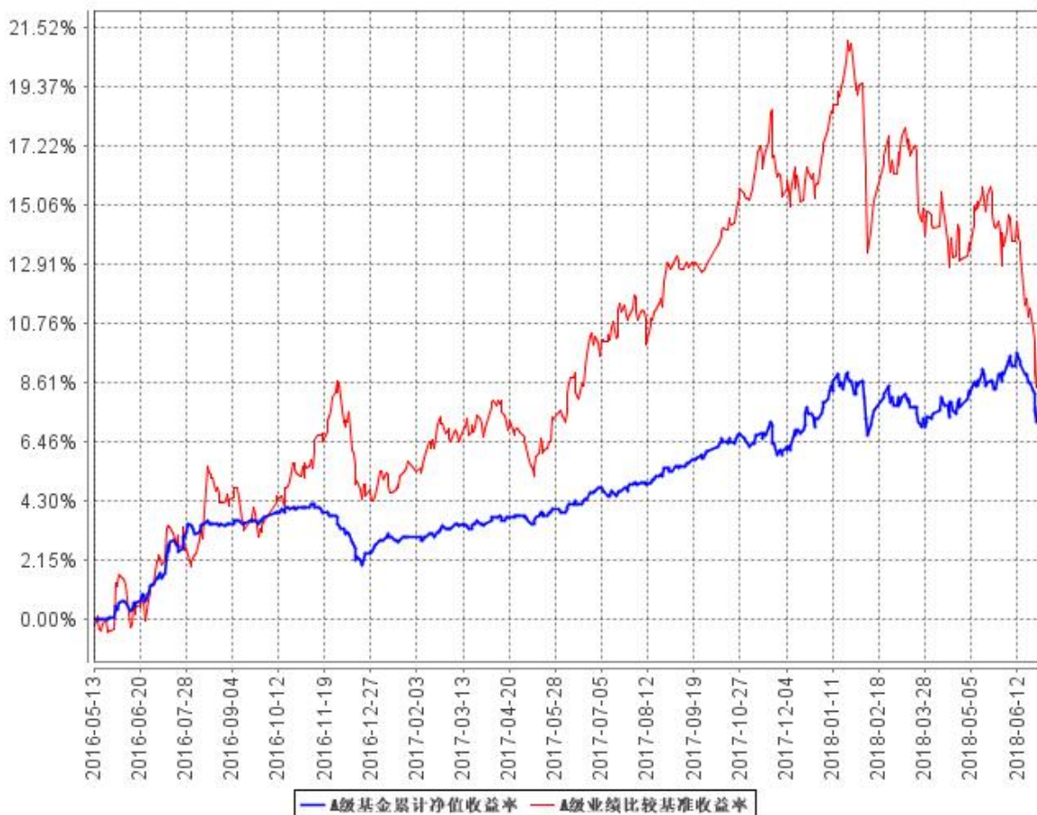
A 级基金累计净值收益率与同期业绩比较基准收益率的历史走势对比图