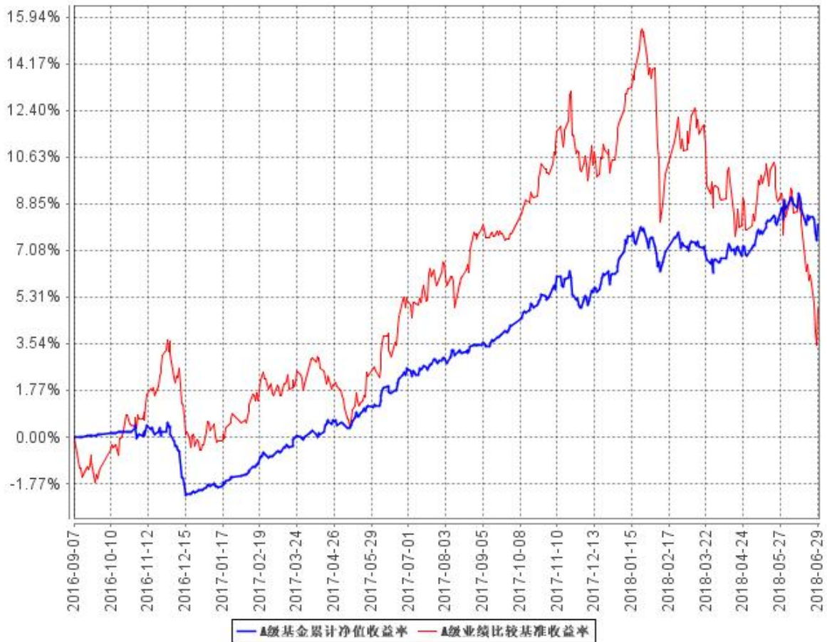
A级基金累计净值收益率与同期业绩比较基准收益率的历史走势对比图