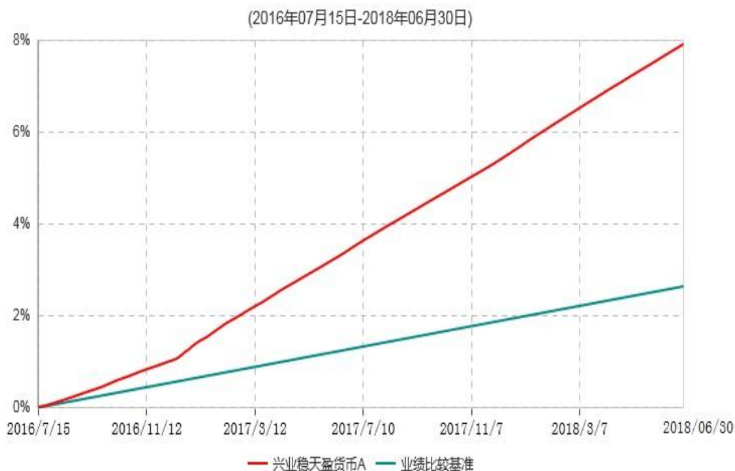
兴业稳天盈货币A累计净值收益率与业绩比较基准收益率历史走势对比图