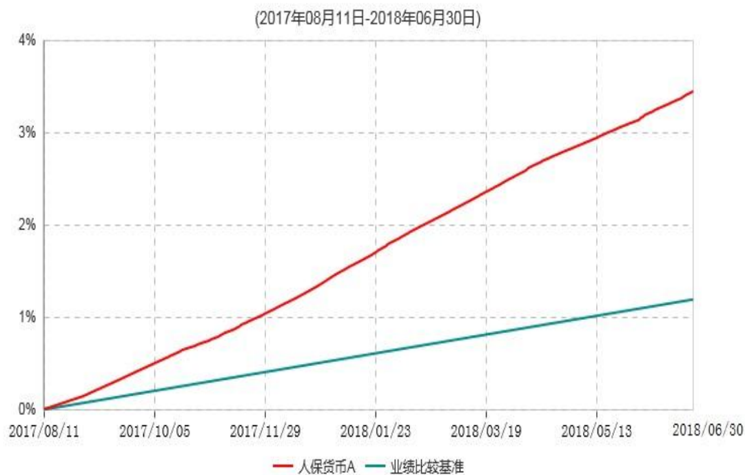
人保货币A累计净值收益率与业绩比较基准收益率历史走势对比图