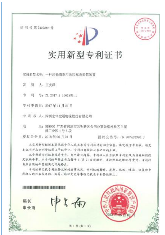
2018 年 6 月 1 日，公司获得“一种超长货车用危险标志提醒装置”实用新型专利。