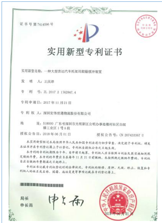
2018 年 6 月 1 日，公司获得“一种大型货运汽车托架用颠簸缓冲装置”实用新型专利。