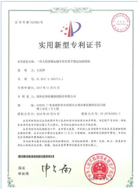
2018 年 6 月 1 日，公司获得“一种大型货物运输车的可放平侧边加固结构”实用新型专利。