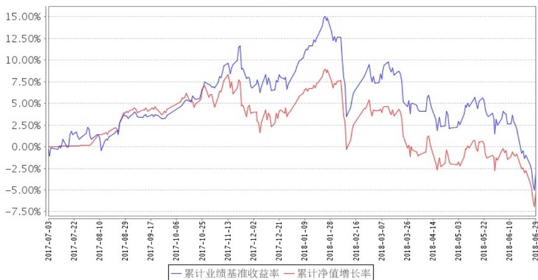
安信量化多因子混合A累计净值增长率与同期业绩比较基准收益率的历史走势对比图