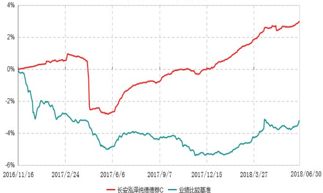
长安泓泽纯债债券C累计净值增长率与业绩比较基准收益率历史走势对比图 (2016年11月16日-2018年06月30日)

本基金基金合同生效日为 2016 年 11 月 16 日，按基金合同规定，本基金自基金合同生效起 6 个月为建仓期，截止到建仓期结束时，本基金的各项投资组合比例已符合基金合同的相关规定。基金合同生效日至报告期期末，本基金运作时间已满一年，图示日期为 2016 年 11 月 16 日至 2018 年 6 月 30 日。