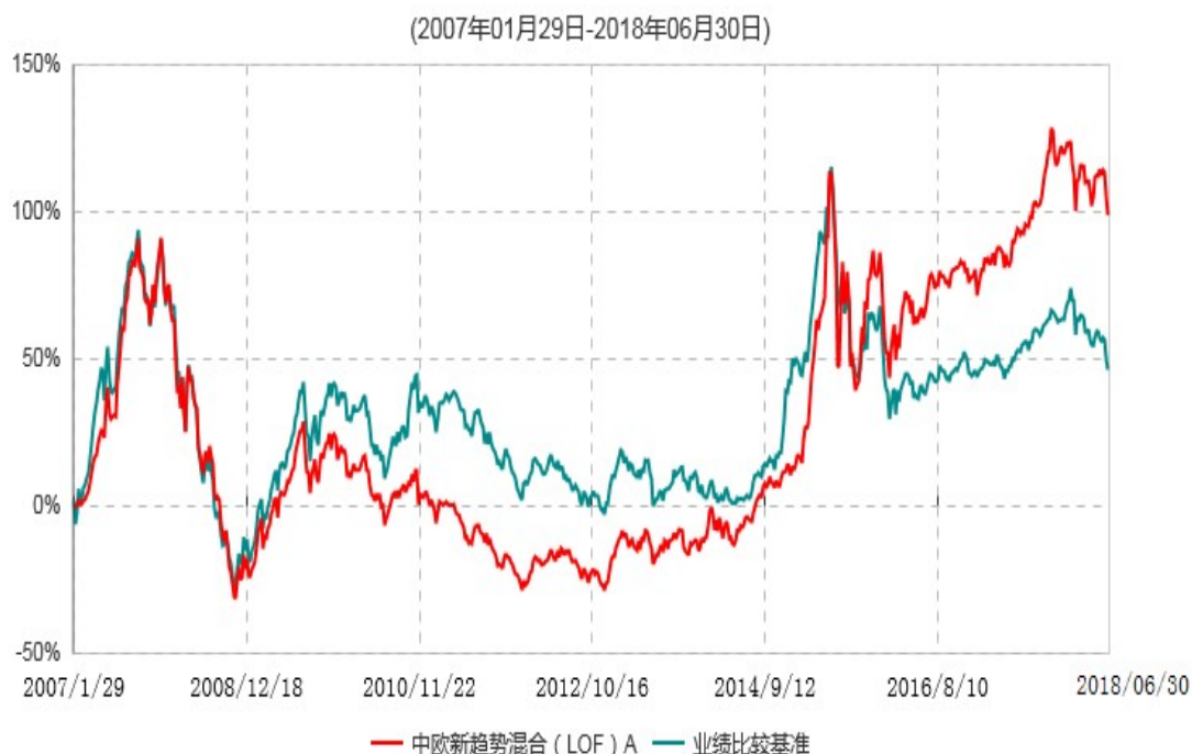
中欧新趋势混合（LOF）A累计净值增长率与业绩比较基准收益率历史走势对比图