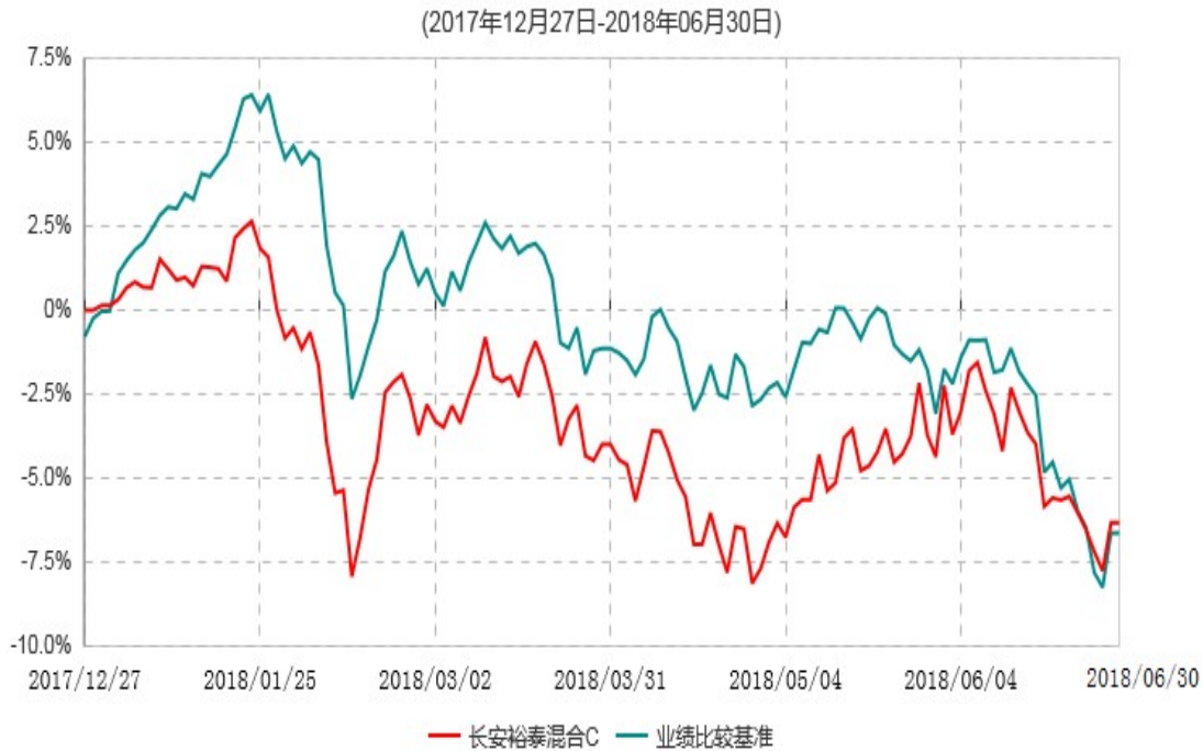
长安裕泰混合C累计净值增长率与业绩比较基准收益率历史走势对比图

根据基金合同的规定,自基金合同生效之日起 6 个月内基金各项资产配置比例需符合基金合同要求。本基金在建仓期结束后,各项资产配置比例已经符合基金合同有关投资比例的约定。基金合同生效日至报告期期末,本基金运作时间未满一年。图示日期为 2017 年 12 月 27 日至 2018 年 06 月 30 日。