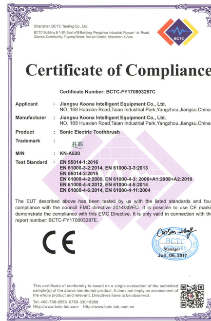
江苏科那智能产品获得 CE 认证