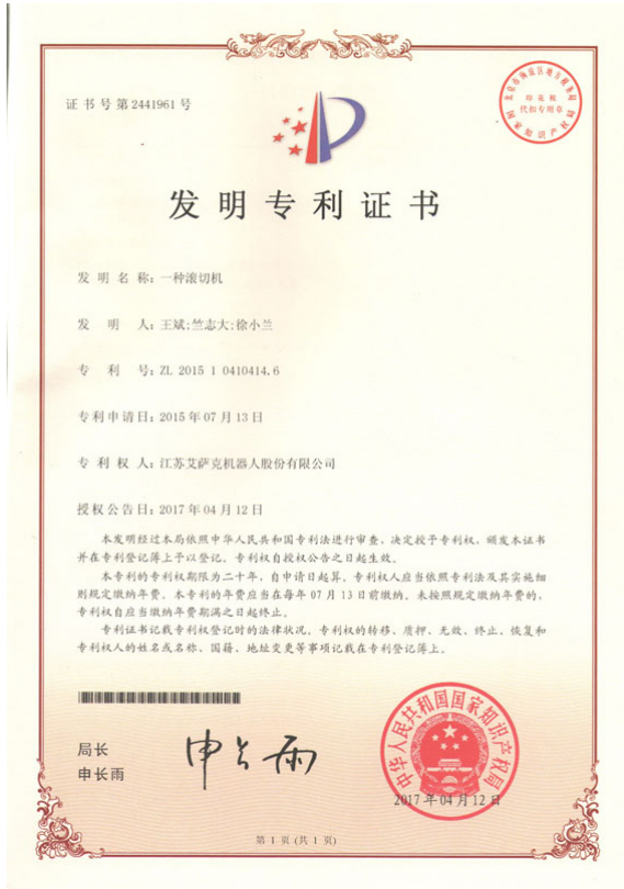
本公司获得发明专利证书