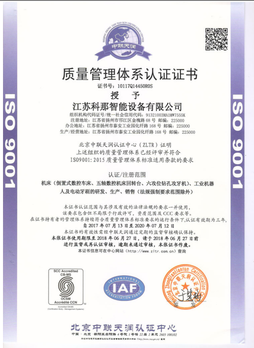
江苏科那智能获得质量管理体系认证证书