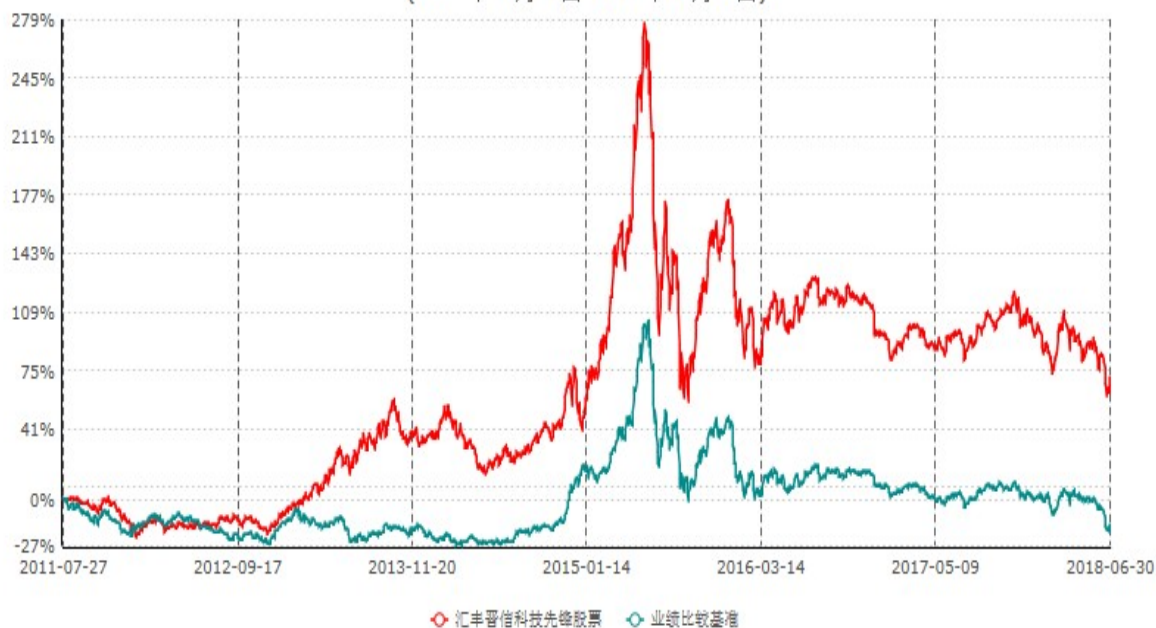
汇丰晋信科技先锋股票型证券投资基金累计净值增长率与业绩比较基准收益率历史走势对比图 (2011年07月27日-2018年06月30日)