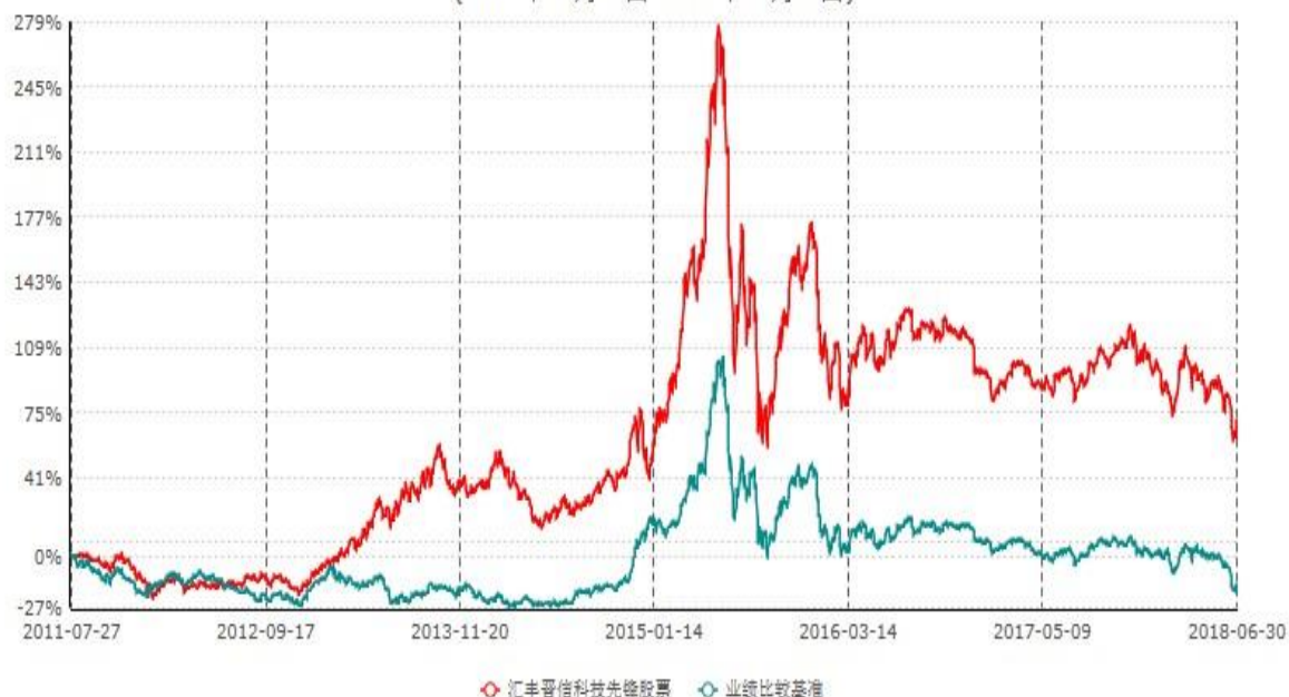
汇丰晋信科技先锋股票型证券投资基金累计净值增长率与业绩比较基准收益率历史走势对比图 (2011年07月27日-2018年06月30日)