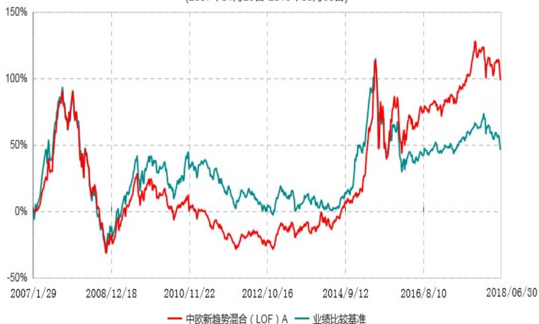
中欧新趋势混合（LOF）E累计净值增长率与业绩比较基准收益率历史走势对比图