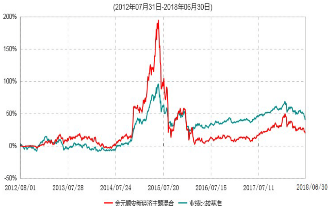
金元顺安新经济主题混合型证券投资基金累计净值增长率与业绩比较基准收益率历史走势对比图