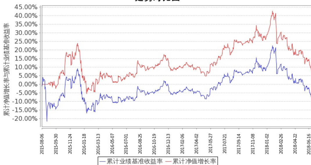
嘉实中证金融地产ETF联接A累计净值增长率与同期业绩比较基准收益率的历史走势对比图

图：嘉实中证金融地产ETF联接A基金份额累计净值增长率与同期业绩比较基准收益率的历史走势对比图