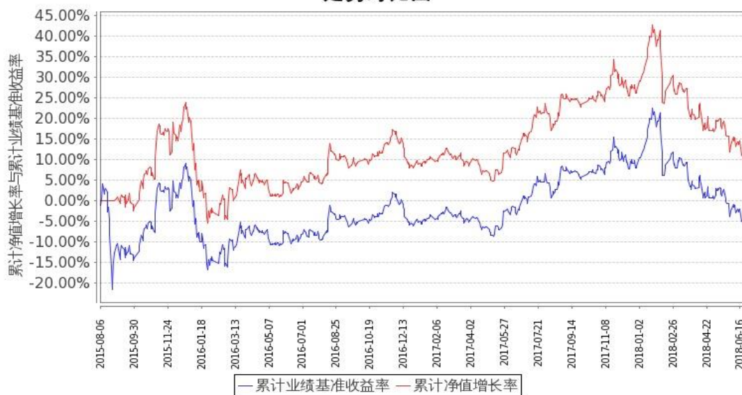
图：嘉实中证金融地产ETF联接A基金份额累计净值增长率与同期业绩比较基准收益率的历史走势对比图